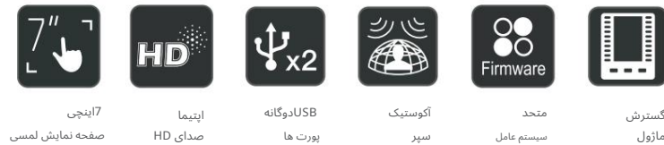
7 اینچی صفحه نمایش لمسی

* فقط هدست BH76 از قابلیت تعویض هوشمند کانال پشتیبانی می کند.