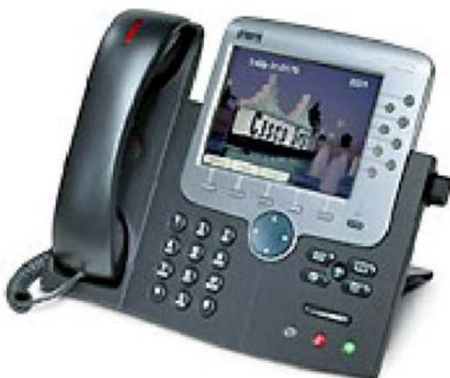
1. شکل Cisco Unified IP Phone 7971G-GE

سیستم ارتباطات یکپارچه سیسکو از محصولات و برنامه‌های ارتباطات صوتی و IP به سازمان‌ها کمک می‌کند تا ارتباط مؤثرتری برقرار کنند - از طریق کمک به آنها برای ساده‌سازی فرآیندهای تجاری، دستیابی به منبع مناسب در اولین بار و افزایش بهره‌وری. مجموعه ارتباطات یکپارچه سیسکو بخشی جدایی ناپذیر از راه حل ارتباطات تجاری سیسکو است - یک راه حل یکپارچه برای سازمان‌ها در هر اندازه که شامل زیرساخت شبکه، امنیت و محصولات مدیریت شبکه نیز می‌شود. اتصال بی سیم؛ و رویکرد خدمات چرخه حیات، همراه با استقرار انعطاف پذیر و گزینه‌های مدیریت برون سپاری، بسته‌های مالی کاربر نهایی و شریک، و برنامه‌های ارتباطی شخص ثالث.